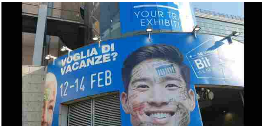
L'ingresso della Bit 2023 a Milano

Milano – Alla base c'è tanta voglia di tornare a viaggiare, in Italia e nel mondo. Le conferme arrivano dalle presenze di espositori a BIT 2023 , all' Allianz MiCo di Milano da domenica 12 a martedì 14 febbraio, che rafforzano il rilancio registrato nel 2022. E lo confermano anche i dati di settore.